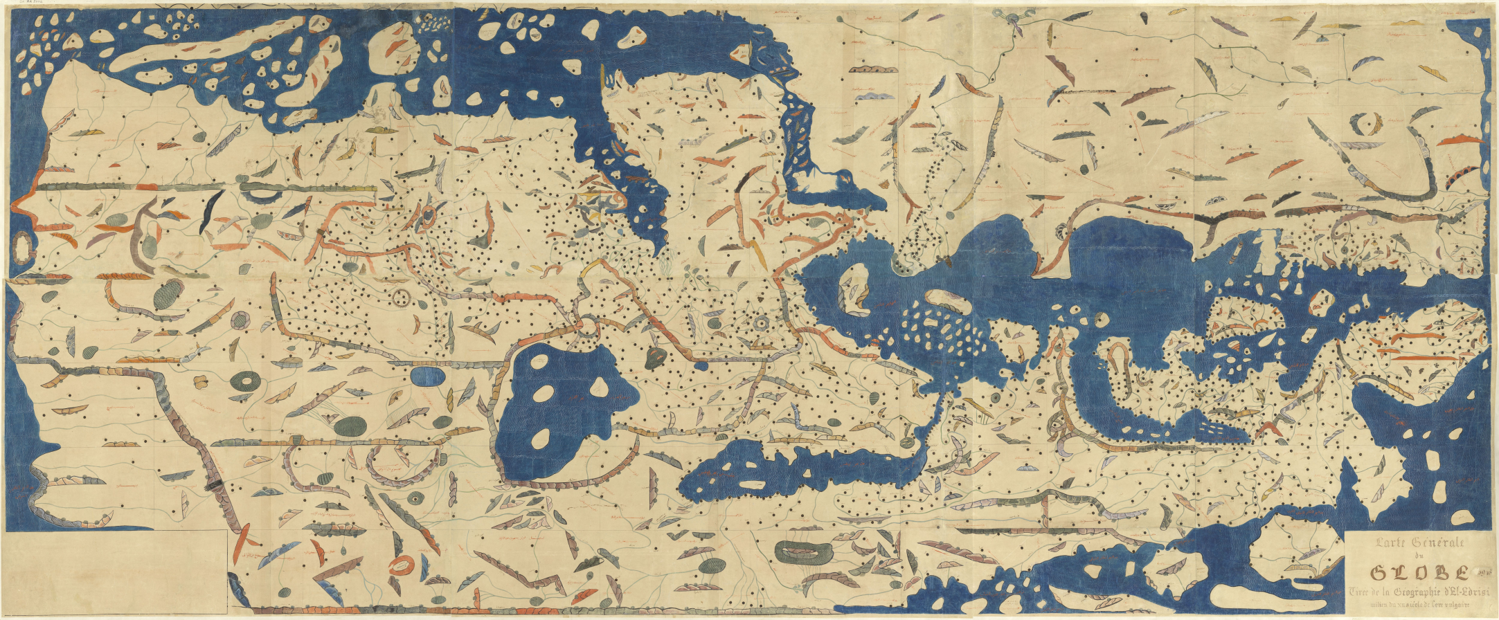
Carte Générale du GLOBE Dessinée par Delisle Citer de la Géographie d'El-Edrisi sur le planisphère de Fern. vulgaire