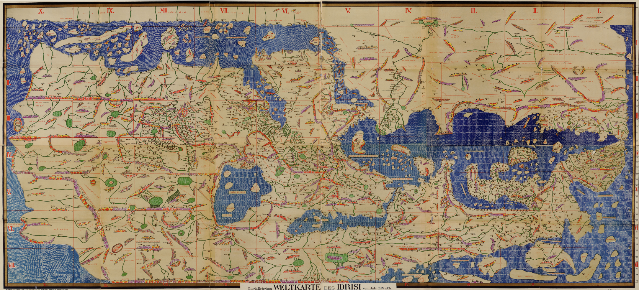
Charta Rogeriana WELTKARTE DES IDRISI vom Jahr 1154 n. Chr.

Wiederhergestellt und herausgegeben von KONRAD MÜLLER, Stuttgart 1938